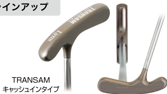
TRANSAM キャッシュインタイプ