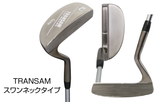
TRANSAM スワンネックタイプ