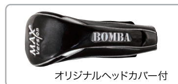
オリジナルヘッドカバー付