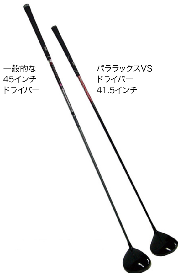
一般的な 45インチ ドライバー