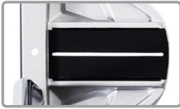
アライメントライン