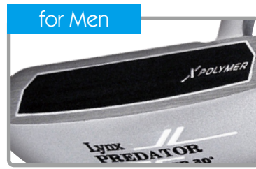
Xポリマーフェース