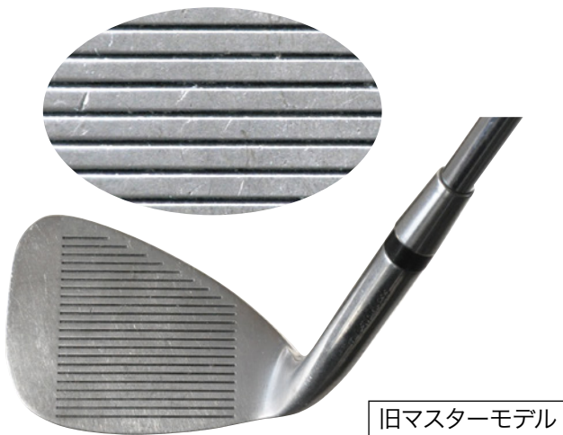
旧マスターモデル

ステンレス材から軟鉄に変えたことで、より柔らかい打感が得られるようになりました。