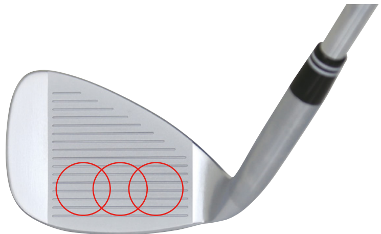
スイートエリアの拡大

ウェイトをトゥ側とヒール側に配分することで慣性モーメントが大きくなり、多少打点がバラ付いても安定したショットが打てます。