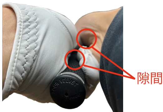
一般的なグリップ