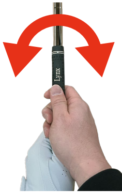
一般的なグリップ