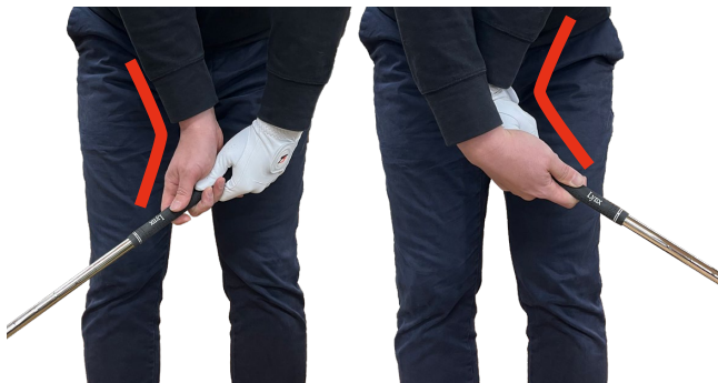
一般的なグリップ